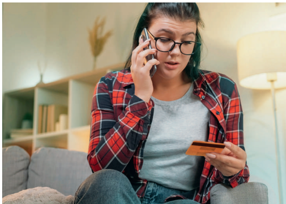
Veel nieuwe vormen van bankhelpdeskfraude worden niet vergoed